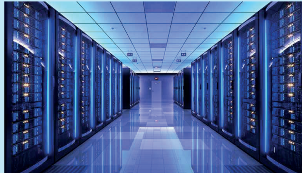
Miongoni mwa miundombinu katika kituo kikuu cha kuhifadhia taarifa (Data center)

• Huduma ya Uwekaji wa vifaa vya elektroniki katika Miundombinu yetu kwa kitaalamu inajulikana kama "Colocation" . • Huduma ya Ukodishaji wa seva kwa ajili ya uhifadhi wa taarifa au mifumo ambayo kitaalamu inajulikana "Virtual Mashine" . Huduma hii humwezesha Mteja na Taasisi za Serikali kupatiwa sehemu ya seva zetu kulingana na mahitaji yao ili kuhifadhi taarifa zao na mifumo katika kituo kikuu cha kuhifadhia taarifa (Data Center) chenye kuzingatia usalama, unafuu, uendelevu na jumuishi. Huduma hii humsaidia mteja huokoa gharama za kununua seva nzima pamoja na gharama za uendeshaji wa kifaa hicho.