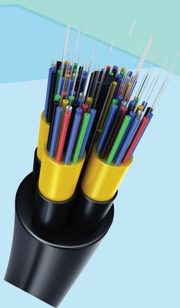
Mkonga unaotumika kusafirishia taarifa

WASILIANA NASI; Simu : 024 2235784 Barua Pepe : info@zictia.go.tz Tovuti : www.zictia.go.tz S.L.P 1823, Mazizini, Zanzibar.