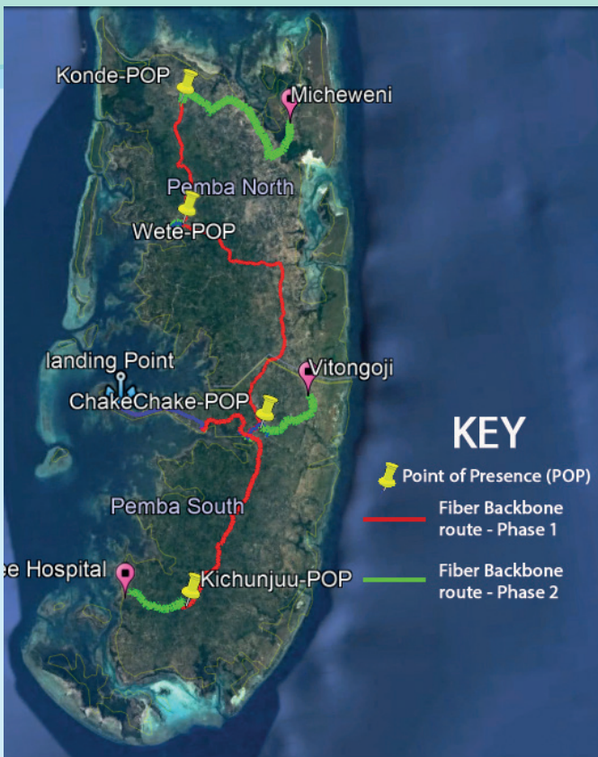
Njia (route) ya mkonga katika kisiwa cha Pemba